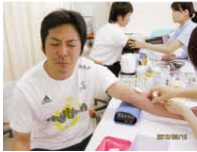
▶大人になっても注射は怖い